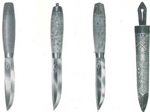
1. 1B. 1C.

1. Täljknivar med skaft av mahognyfärgad björk.